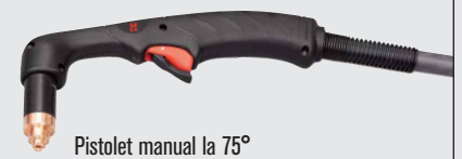
Pistol manual la 75°

(pentru mai multe tipuri de pistolete, consultați www.hypertherm.com )