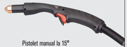
Pistol manual la 15°