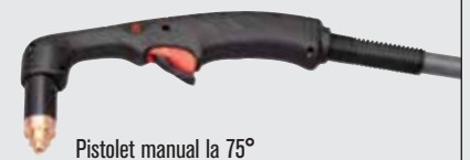
Pistol manual la 75°

(pentru mai multe tipuri de pistolete, consultați www.hypertherm.com )