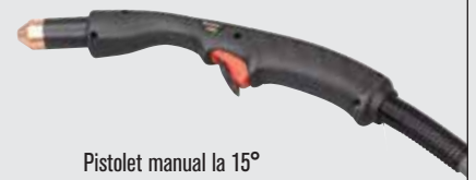
Pistol manual la 15°